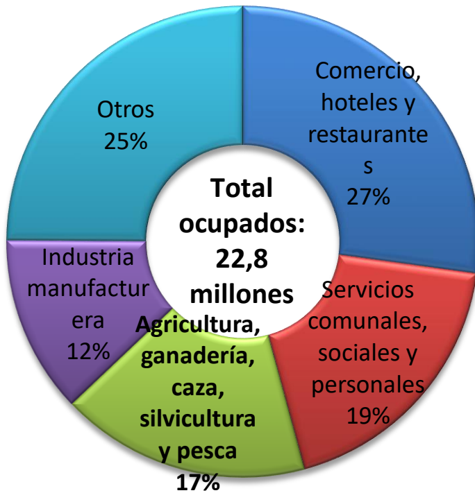
Participación por Ramas en el Empleo 2017

Del total de ocupados en los centros poblados y rural disperso, 64% son Agro.