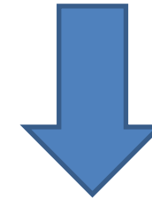
Posición de los ocupados en las áreas rurales

Del total de ocupados en los centros poblados y rural disperso, 64% son Agro.